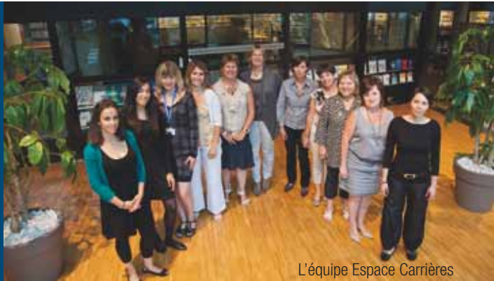
L'équipe Espace Carrières

Le développement international de notre institution vise à satisfaire les besoins de formation multiculturelle de nos étudiants, d'échanges professionnels de nos professeurs et de recrutement de nos entreprises partenaires, locales et internationales.